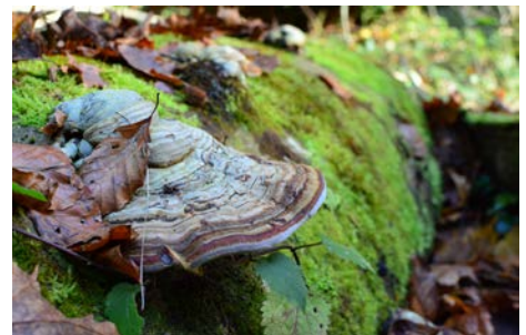
Pilze in ihrem Element